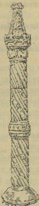
O Pelourinho de Turquel (1)

A este pelourinho faltam os respectivos degraus, que seguramente havia de ter como todos os outros; e notam-se pequenos defeitos na columna, pouco sensíveis, porém, se attendermos á sua antiguidade e ainda ao facto do completo abandono a que esteve